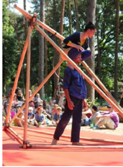
SOL DE NOCHE, 2015