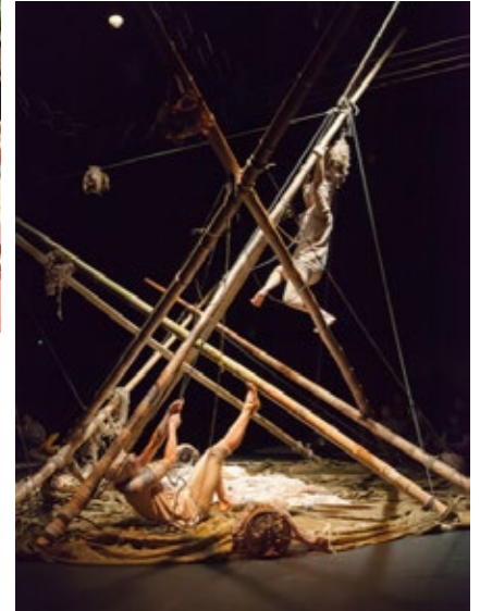
QUI POUSSE, 2017