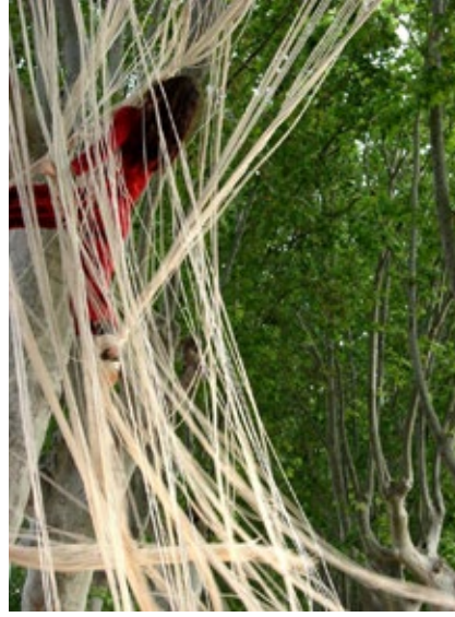
ARIANE(S), CHEMINS CROISÉS

Depuis le spectacle Marche ou rêve en 2012, la compagnie développe plus particulièrement la création pour le jeune et très jeune public ( Sol de Noche 2014, Qui pousse 2017, Twinkle 2018). Depuis 2013, elle mène un vaste projet de recherche et de création intitulé Mue , sur les espaces sensoriels et imaginaires du corps en relation à environnement architectural, social, etc... - projet qui nourrit aussi bien les créations que les différents types de rencontres envisagés avec les publics de tous âges, de la naissance à la fin de vie. Mue tire un fil rouge qui soutient le projet de territoire de la compagnie, en résidence d'implantation dans la ville de Romainville pour 3 saisons de 2016 à 2019, en partenariat avec le département de la Seine-Saint-Denis et la région IDF.