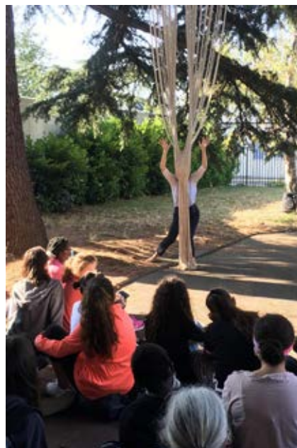
DE SES MAINS AU COLLÈGE ST EXUPÉRY À EAUBONNE (95)