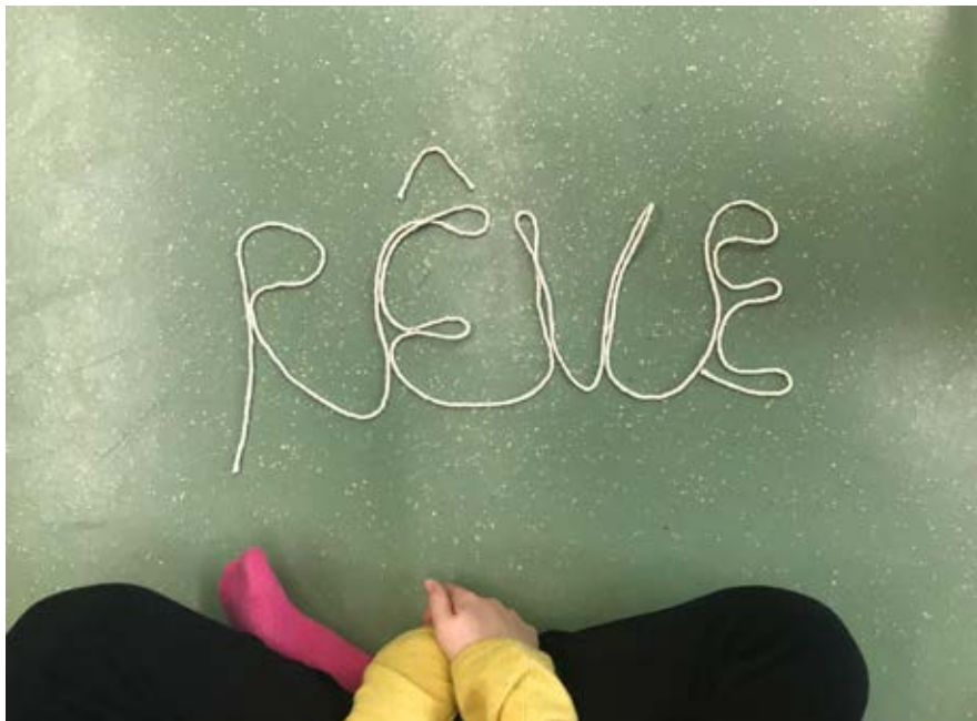
ATELIERS « AU FIL DES MOTS » À L'ÉCOLE ÉLÉMENTAIRE PÉRI À ROMAINVILLE (93)