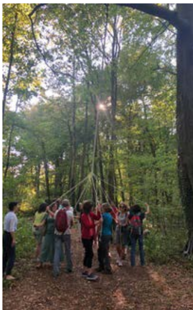
L'ARBRE DE MAI AU FESTIVAL GRAND BOL D'AIR (60)