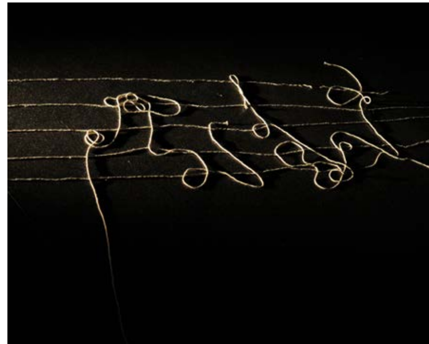
© CÉCILE MONT-REYNAUD - FIL QUI TRACE UNE PARTITION GRAPHIQUE

La parole du monde - Praline Gay-Para et Geneviève Calame-Griaule