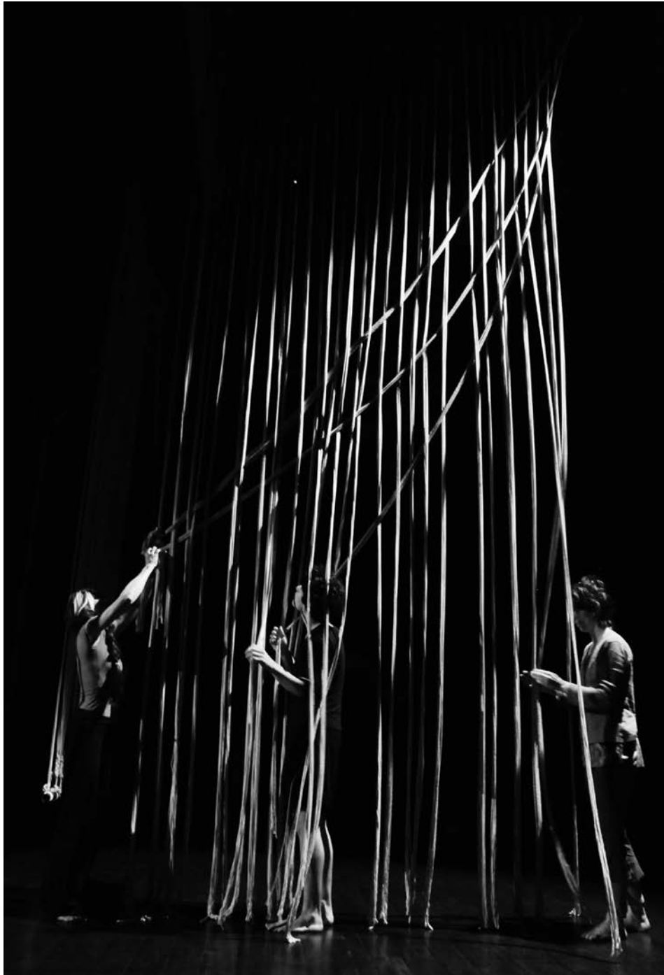
© DROITS RÉSERVÉS - CIE LUNATIC