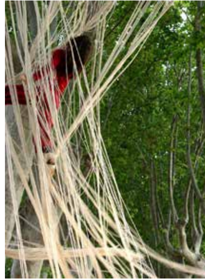
ARIANE(S) CHEMINS CROISES

Depuis le spectacle Marche ou rêve en 2012, la compagnie développe plus particulièrement la création pour le jeune et très jeune public ( Sol de Noche 2014, Qui pousse 2017, Twinkle 2018). Depuis 2013, elle mène un vaste projet de recherche et de création intitulé Mue , sur les espaces sensoriels et imaginaires du corps en relation à environnement architectural, social, etc... - projet qui nourrit aussi bien les créations que les différents types de rencontres envisagés avec les publics de tous âges, de la naissance à la fin de vie. Mue tire un fil rouge qui soutient le projet de territoire de la compagnie, en résidence d'implantation dans la ville de Romainville pour 3 saisons de 2016 à 2019, en partenariat avec le département de la Seine-Saint-Denis et la région IDF.