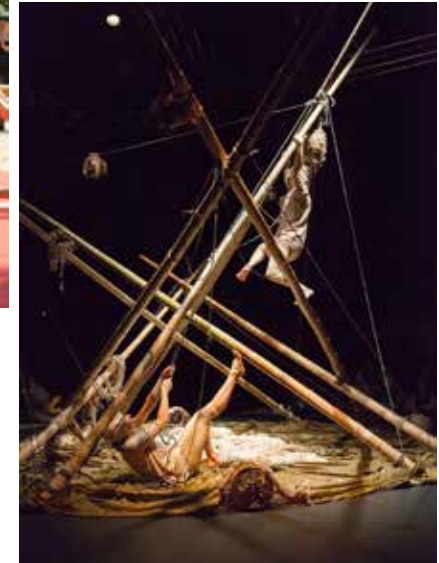
QUI POUSSE, 2017