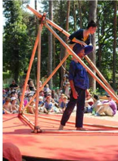
SOL DE NOCHE, 2015