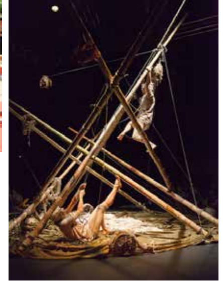
QUI POUSSE, 2017