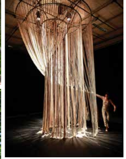
MARCHE OU RÊVE, 2012