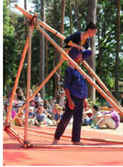
SOL DE NOCHE, 2015