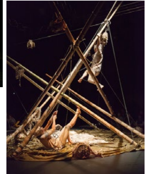
QUI POUSSE, 2017