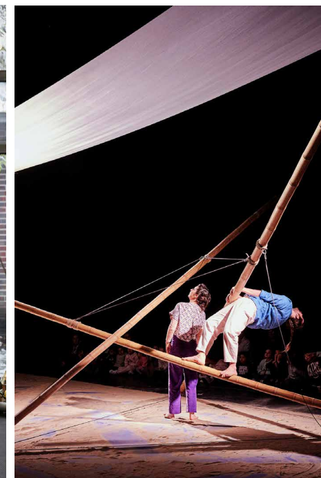
ENTRE LES LIGNES