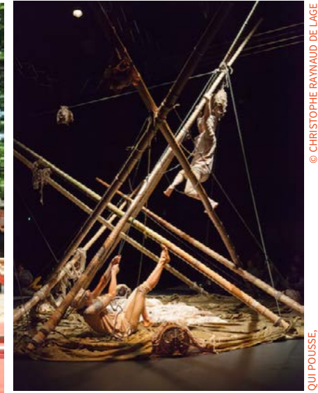
QUI POUSSE, 2017