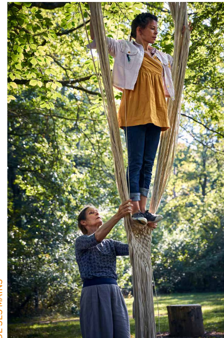
DE SES MAINS

Membre actif du collectif Puzzle, de la plateforme jeune public Ile d'Enfance et de Scènes d'Enfance-ASSITEJ, la Compagnie Lunatic est conventionnée par la DRAC Ile-de-France depuis 2020. Elle est associée au Dunois/Théâtre du Parc - Scène pour un Jardin Planétaire depuis 2019 et à Un Neuf Trois Soleil ! pour la saison 2022-23.