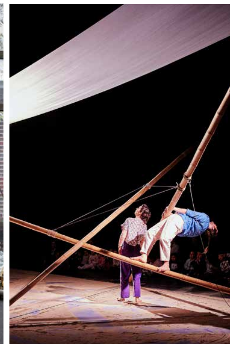
ENTRE LES LIGNES