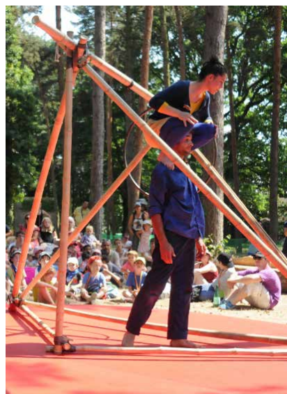
SOL DE NOCHE, 2015