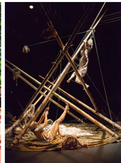
QUI POUSSE, 2017