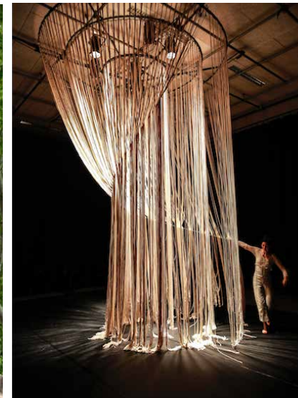
MARCHE OU RÊVE, 2012