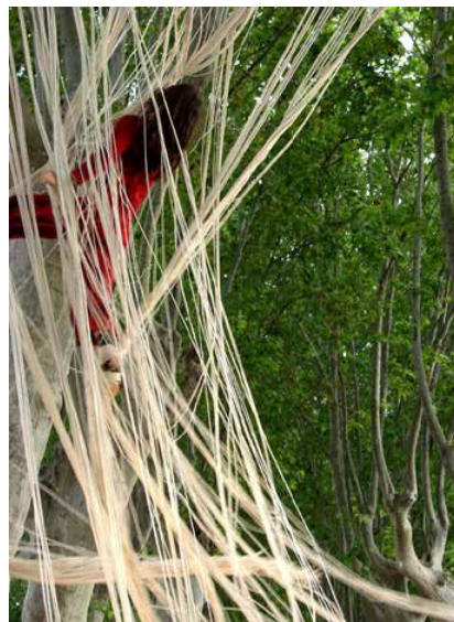
ARIANE(S) CHEMINS CROISÉS