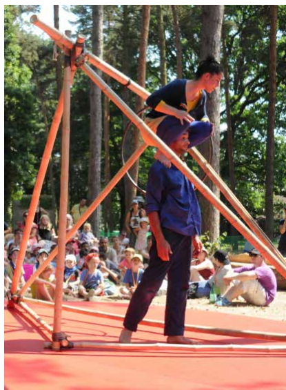
SOL DE NOCHE, 2015