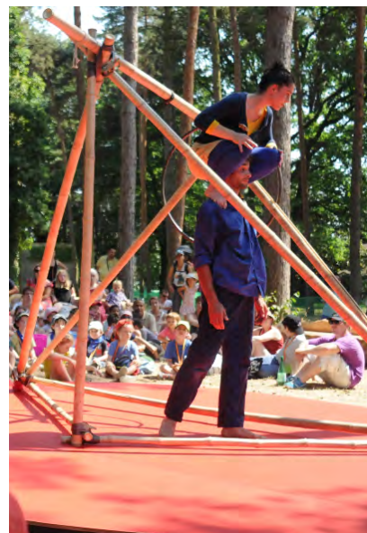
SOL DE NOCHE, 2015